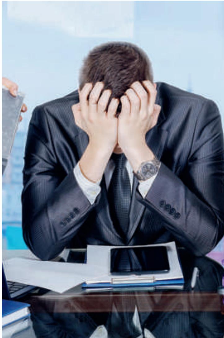
À la souffrance physique des patrons, s'ajoute la souffrance morale.

Et pourtant rien n'est prévu pour les patrons. "Les services de santé ont été conçus pour les salariés. Pour les autres, il n'y a rien", poursuit Olivier Torrès, expliquant ainsi la création, en 2009, de Amarok, qui s'intéresse à la santé physique et mentale des travailleurs non salariés. Il fédère une quinzaine de chercheurs qui étudie les liens entre la santé de l'entreprise et celle de son dirigeant. "Quand j'ai vu la détresse de certains patrons, j'ai créé Amarok Assistance." L'idée: proposer des